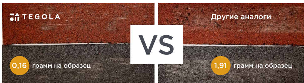
Образцы черепицы после испытаний Brush-Test

Результаты BRUSH-TEST. Испытания на надежность базальтовой посыпки.